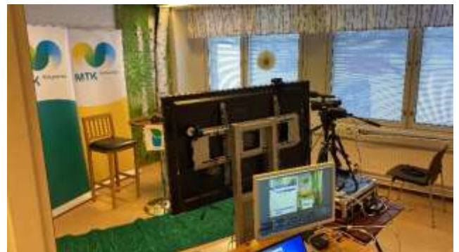
4 Liiton "studio" hahmottumassa

Ensimmäinen koronavuosi pakotti suuren toiminnalliseen muutokseen. Toisena koronavuotena 2021 etäkokouksissa ja erilaisissa webinaareissa oli vakiintuneen toiminnan tuntua. Toimintavuonna 2022 oli etäosallistuminen jo hyvin