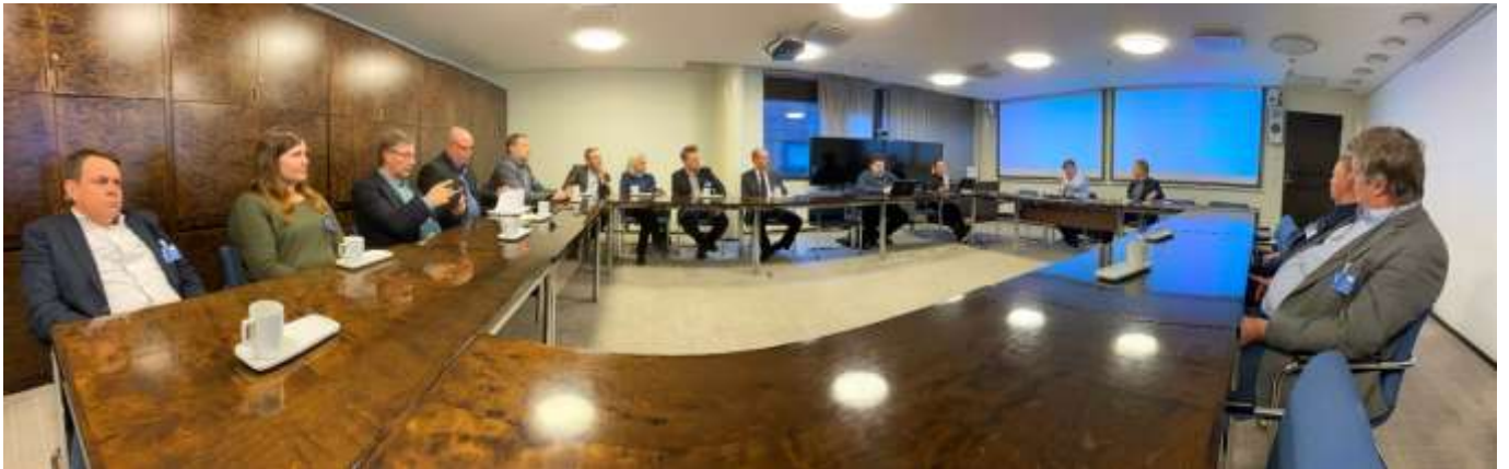
11 Johtokunta tapasi strategiatyön yhteydessä kansanedustajia eduskunnassa

Elokuun kokouksessa keskusteltiin kesän sato- ja näkymistä ja todettiin kesän olleen varsin vaihteleva eri puolilla. Alueelliset erot mm. sateen suhteen olivat suuria. Pääosin sato-odotukset olivat hyvät.