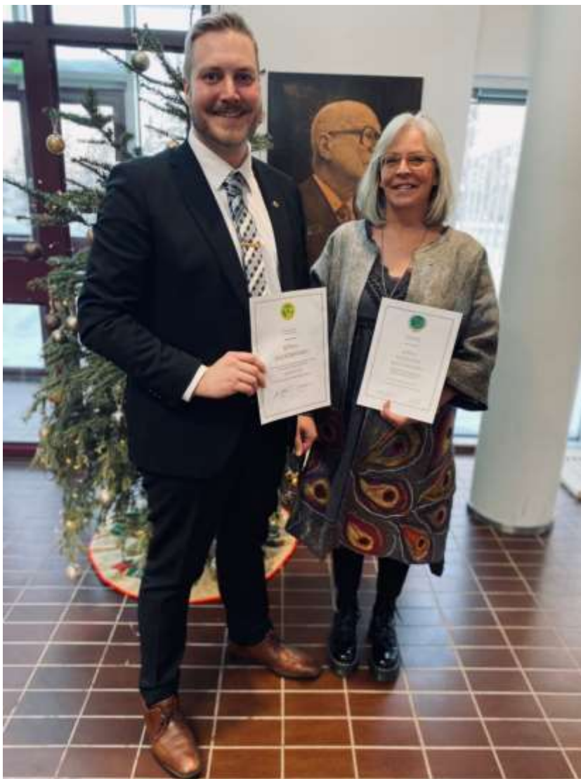
14 Jaakolle luovutettiin MTK:n ansiomerkki ja Päiville kultainen ansiomerkki. Kekkonen taustalla tarkkailee menoa.