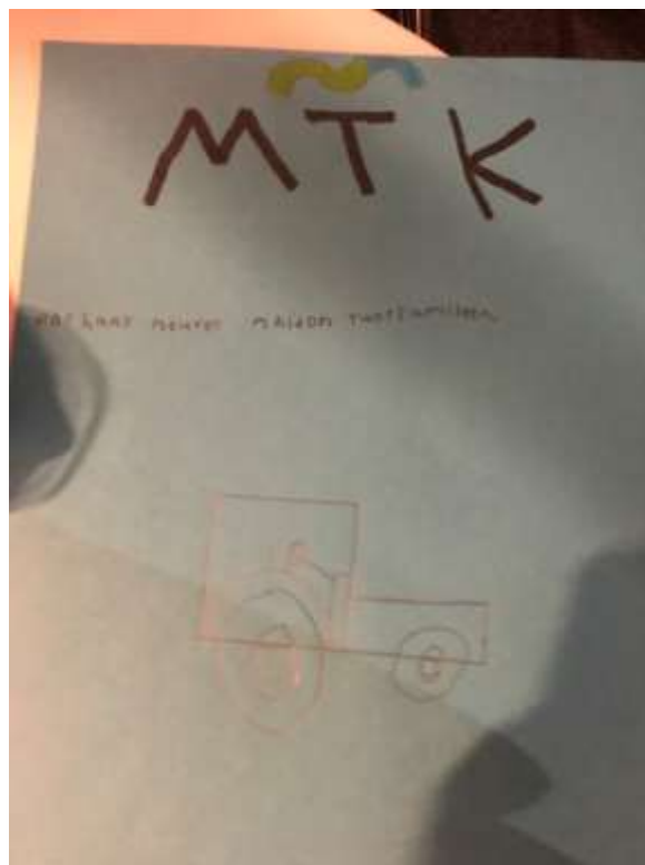
5 Yrityskylän terveiset liitolle

MTKlaista yhteishenkeä lisäsi myös se, että elokuun alusta lähtien ovat kaikki niin liiton kuin Pirkanmaalla asuvat keskusliiton toimihenkilöt työskennelleet samoissa toimitiloissa.