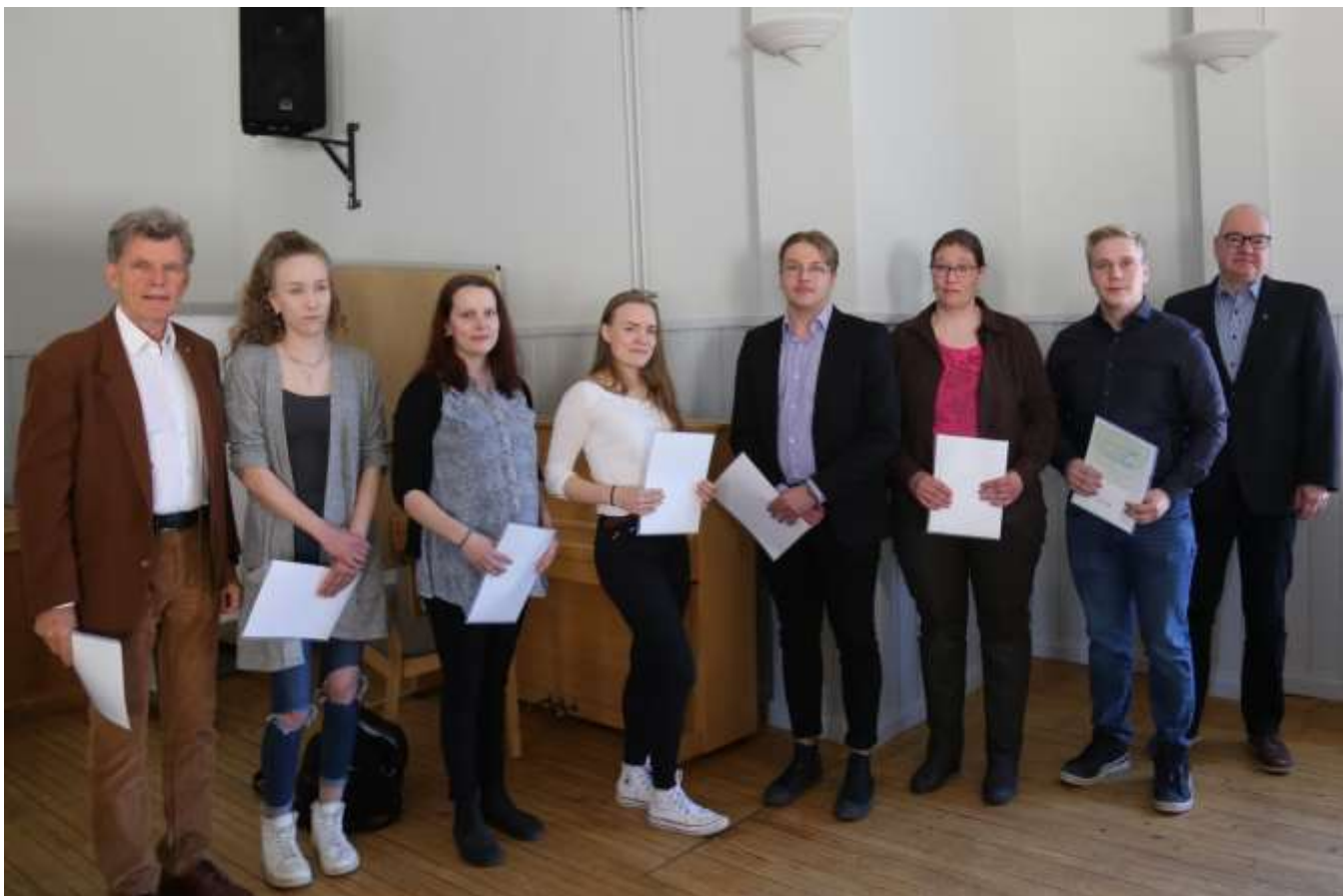
6 Salonteen säätiön stipendinsaaajat. Niiden luovuttajat reunoilla.