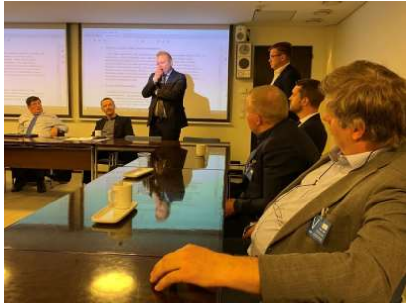
12 Ministeri Kurvinenkin ehti tervehtimään liiton johtokuntaa. Tiukkaa keskustelua.

Suomi-rata huolestuttaa Etelä-Pirkanmaalla. Se on saattanut vaikuttaa jopa jossain tapauksessa mm. maatilan lainansaantiin. Varmuutta syystä ei ole mutta tällainen epäily on tullut esille. Maankäyttöasiat myös Nurmi-Sorila-alueella keskusteluttavat. Alueella on menossa kaavamuuksu ja siinä yritetään saada mm. golf-kenttää alueelle. MTK:n roolina on huolehtia siitä, että maanomistajia kuullaan aidosti ja että he voivat vaikuttaa asioihin. Meidän pitää myös huolehtia siitä, etteipakkolunastusta voida käyttää golfkentän tarvitseman maa-alueen lunastamiseen. MTK ei voi ottaa kantaa eri vaihtoehtoihin sillä silloin ollaan helposti ”jäsenten välisessä kiistassa” osapuolena. Korostamme maanomistajan itsenäistä päätösvaltaa.